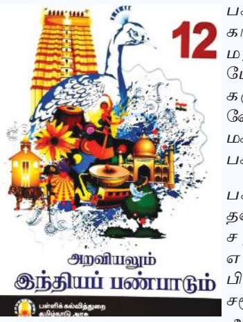
அறிவியலும் இந்தியப் பண்பாடும்

தேசியகல்விக் கொள்கை நடைமுறைக்கு வந்தபோது அதற்கு எதிர்ப்பு தெரிவித்ததோடு மட்டுமல்லாமல் அதற்கு எதிராக தமிழ்நாடு மாநில கல்விக் கொள்கை என்ற ஒன்றை தமிழ்நாடு அரசு சமீபத்தில் முன்வைத்தது. தமிழ்நாடு அரசு முன்வைத்த மாநில கல்விக் கொள்கையில் பல்வேறு பிரிவுகள் தேசியகல்விக் கொள்கையை ஒத்ததாக இருப்பதாக பல்வேறு கல்வியாளர்கள் குற்றம் சாட்டி வந்தனர். இதற்கிடையே தமிழ்நாடு அரசு தேசியகல்விக் கொள்கையை ஏற்றுக் கொண்டுவிட்டது போல் தமிழ்நாடு அரசின் கீழ் இயங்கக்கூடிய தமிழ்நாடு பாடநூல் கழகம் வெளியிட்டுள்ள 12-ம் வகுப்பு "அறிவியலும் இந்திய பண்பாடும்" என்கிற பாட புத்தகத்தில் தேசிய கல்விக் கொள்கையில் சொல்லப்பட்ட பல்வேறு கருத்துக்கள் இந்த பாடப்புத்தகத்திலும் இடம்பெற்று இருக்கிறது.