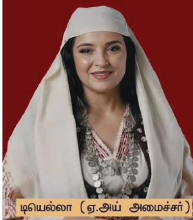
டியெல்லா (ஏ.அம் அமைச்சர்)

உலகில் முதன் முதலாக செயற்கை நுண்ணறிவு தொழில்நுட்பம் (ஏ.அம்) அமைச்சர் பதவியை ஏற்று இருக்கிறது. அந்த அமைச்சரின் பெயர் 'டியெல்லா'. அல்பேனியா நாட்டின் பிரதமர் ஏ.டி ராமா கடந்த செப்டம்பர் 11-ஆம் தேதி செயற்கை நுண்ணறிவு தொழில்நுட்பத்தை தனது அமைச்சரவையில் இணைத்துள்ளார். 'டியெல்லா'வுக்கு ஊழல் ஒழிப்புத்துறை ஒதுக்கப்பட்டுள்ளது. இந்த செயற்கை நுண்ணறிவு தொழில்நுட்பம் அல்பேனியா இணையதளத்தின் உதவியாளராக கடந்த ஜனவரியில் நியமனம் செய்யப்பட்டது. இப்போது அமைச்சராக பதவி உயர்வு தரப்பட்டுள்ளது. உலகிலேயே முதன்முதலாக அமைச்சராக பதவி ஏற்றுள்ளது 'டியெல்லா' என்ற செயற்கை நுண்ணறிவு தொழில்நுட்பம். டியெல்லாவுக்கு அல்பேனிய நாட்டின் பாரம்பரிய உடை அணிந்த பெண் உருவம் தரப்பட்டுள்ளது. 28 லட்சம் மக்கள் தொகை கொண்ட அல்பேனியா, ஐரோப்பாவில் தென்கிழக்கு பகுதியில் அமைந்துள்ளது. இஸ்லாமியர்களை பெரும்பான்மையாகக் கொண்டது இந்த நாடு. 18 வயதுக்கு உட்பட்ட நல்ல மனநிலை உள்ள எவரும் அமைச்சராக முடியும் என்று அல்பேனியாவின் அரசியல் சட்டம் கூறுகிறது.