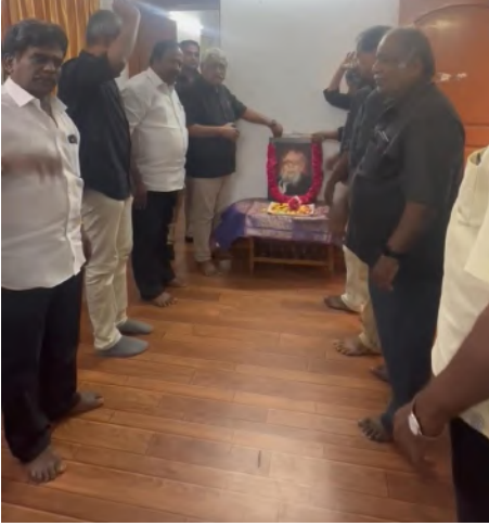
பேரவைத் தலைமை அலுவலகம்