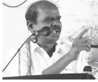
பெரியார் தொடங்கிய திராவிடர் விவசாய தொழிலாளர் சங்கம் ஜாத் - தீண்டாமமை எதிர்ப்பையும் பேசியது

இந்தியாவிலும் அதே நிலைமை தான். அதிகாரக் கட்டமைப்பு உள்ளது. சட்டமன்ற உறுப்பினர், நாடாளுமன்ற உறுப்பினர்களை விட அதிகாரிகள் தான் நிர்வாகங்களை நடத்தி வந்தனர். இன்று வரை அப்படியொரு நிலைமை தான். அந்த அதிகாரிகள் பார்ப்பனர்களாகத்தான் இன்று வரை இருக்கிறார்கள். முதல் தர பணிகளில் 5 சதவீதம் வரை கூட ஆதி திராவிடர்கள் வரவில்லை. இட