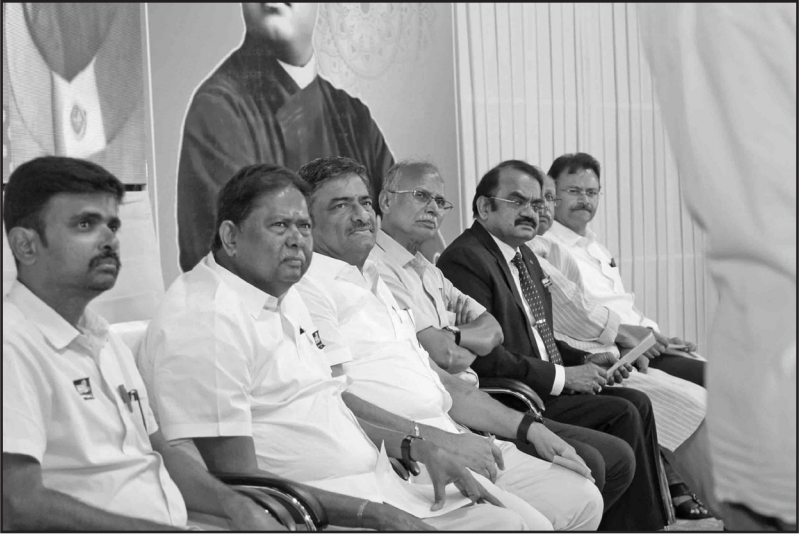
நிகழ்வு மேடையில் ஆளுமைகள்